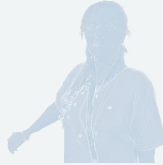
ART / ASSESS Cheffe de projets